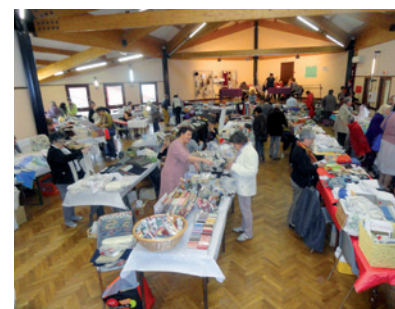
Les Puces des couturières