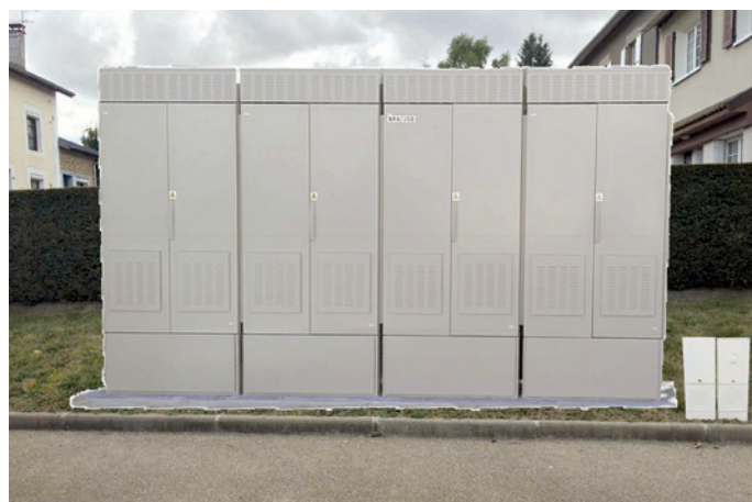
NRA MED – Bonnac-la-Côte - CA Limoges Métropole

Pour cela il s'agit de créer un lien fibre optique entre le « Nœud de Raccordement Actif » (NRA) et le « Sous-Répartiteur » (SR) permettant d'améliorer l'injection des signaux dans la mesure où la longueur du réseau de cuivre est raccourcie (cf. schémas ci-dessous).