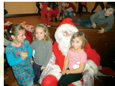
Le Père Noël était très présent sur la commune