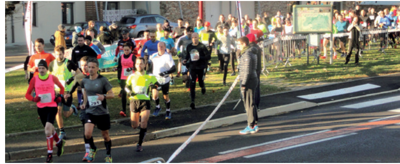
Le traditionnel trail de Bonnac