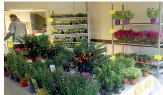
La Fête des fleurs d'automne